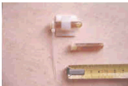
Ampolle utilizzate nel biorisanamento, brevettate

corrente sotterranea e della relativa faglia, ed infine quelle lasciate dalla costante esposizione ai vettori artificiali come radar, ripetitori radiotelevisivi e telefonici, satelliti geostazionari, linee elettriche. La particolare disposizione sul corpo di questi segnali evidenzierà le zone spesso doloranti dove la persona è colpita dalle influenze nocive, che generalmente sono all'origine dei suoi problemi di salute. L'intervento di biorisanamento consiste poi nel neutralizzare le influenze patogene individuate con l'antenna Lecher, senza procedere ad alcuno spostamento del letto.