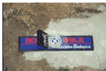
Antenna Biodin utilizzata nel biorisanamento, brevettata

corrente sotterranea e della relativa faglia, ed infine quelle lasciate dalla costante esposizione ai vettori artificiali come radar, ripetitori radiotelevisivi e telefonici, satelliti geostazionari, linee elettriche. La particolare disposizione sul corpo di questi segnali evidenzierà le zone spesso doloranti dove la persona è colpita dalle influenze nocive, che generalmente sono all'origine dei suoi problemi di salute. L'intervento di biorisanamento consiste poi nel neutralizzare le influenze patogene individuate con l'antenna Lecher, senza procedere ad alcuno spostamento del letto.